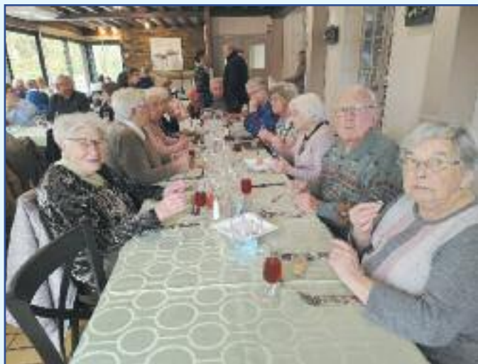
Repas du Club : « Relais de Pouilly »