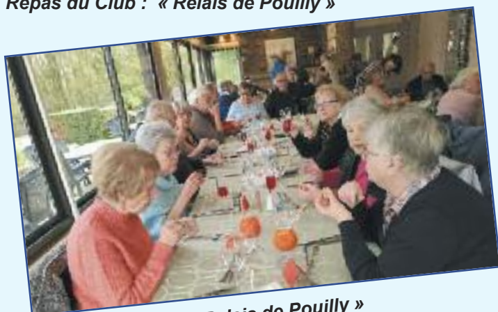
Repas du Club : « Relais de Pouilly »