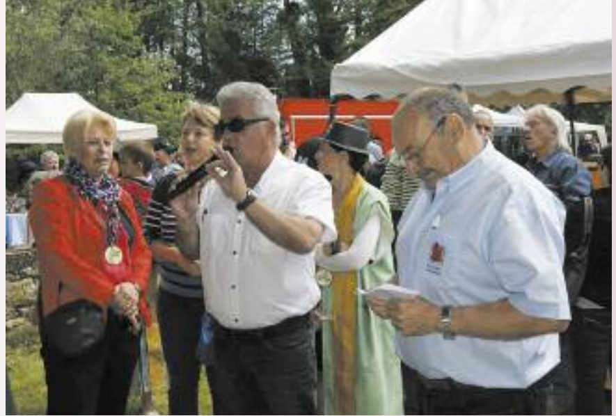
Fête de la grenouille 2015