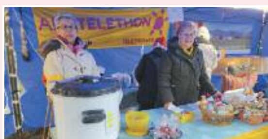
L'équipe de Mesves Anim'