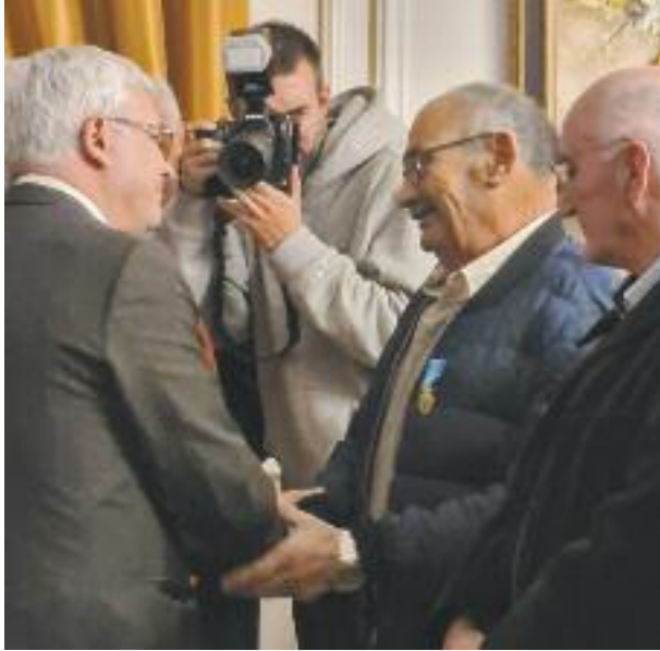
Remise de la médaille de la jeunesse, des sports et de l'engagement associatif.