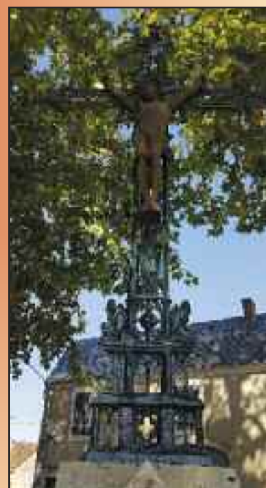
Réfection de la peinture sur la croix élevée par la famille De Bourgoing en 1868, route d'Antibes, sortie Nord.