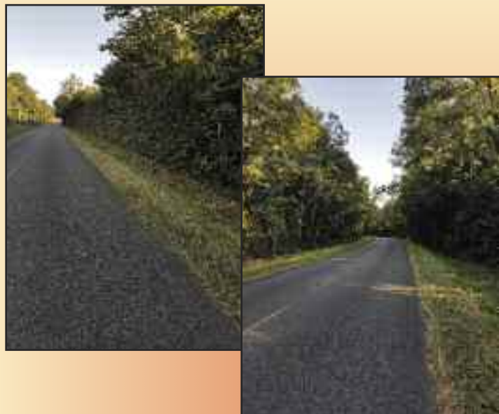
Suite à la tempête Carmen du 1 er janvier 2018, élagage de la route du Motel.