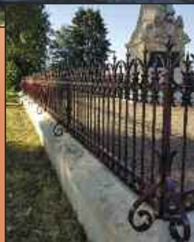
Peinture des grilles du Monument de 1870.