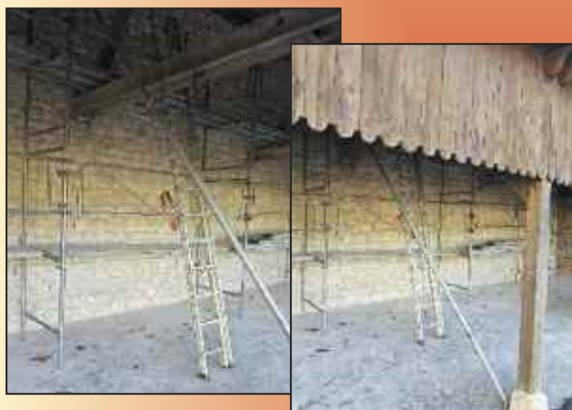
Rénovation du préau de l'école.