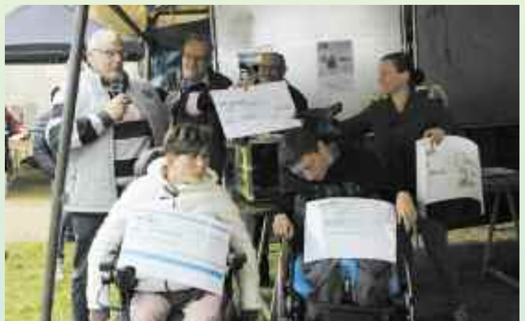
Remise des chèques