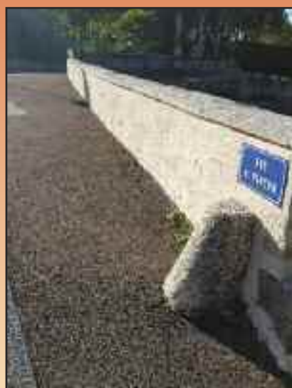
Réfection de l'enduit du muret du Pont du Mazou.