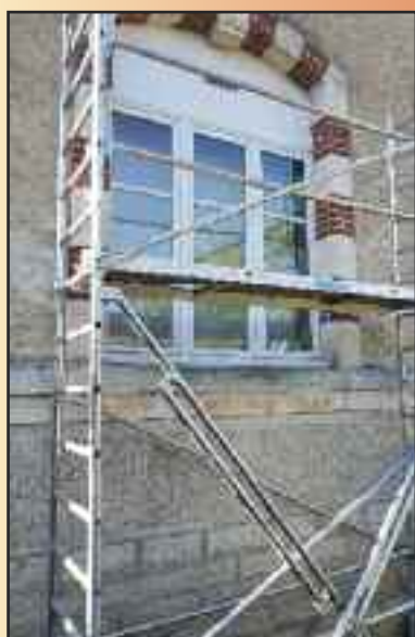
Peinture des fenêtres et portes de l'école.