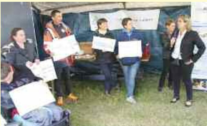
Allocution de Mme Perrine GOULET, Députée de la Nièvre.