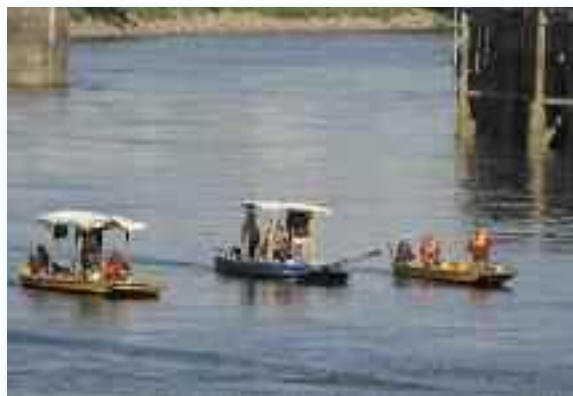
Arrivée de 3 bateaux à Nantes