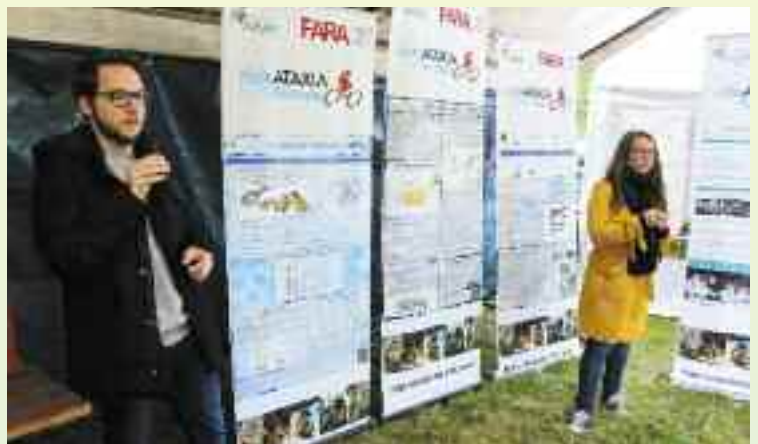
Conférence donnée par les chercheurs de l'Institut Génétique de Strasbourg