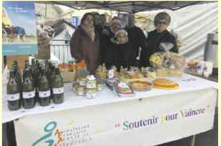
Le jour du Village de Noël, des bénévoles ont vendu des produits au profit du Vend'Espoir.