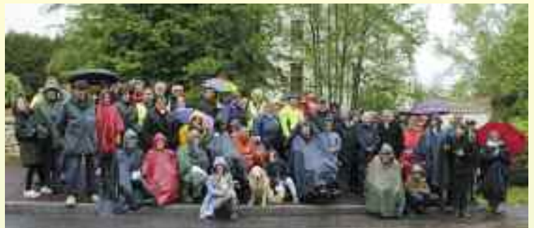
Le groupe de marcheurs