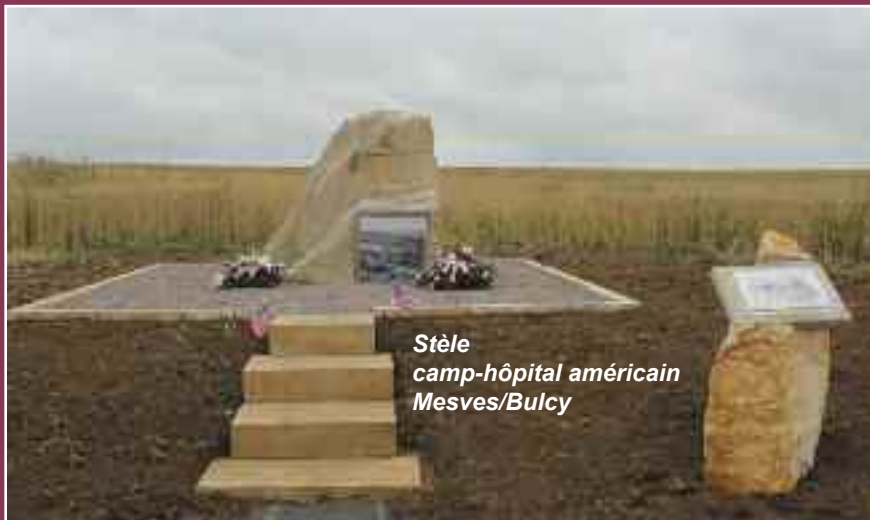
Stèle camp-hôpital américain Mesves/Bulcy