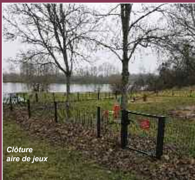
Clôture aire de jeux