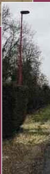
Candélabres rue du Cimetière