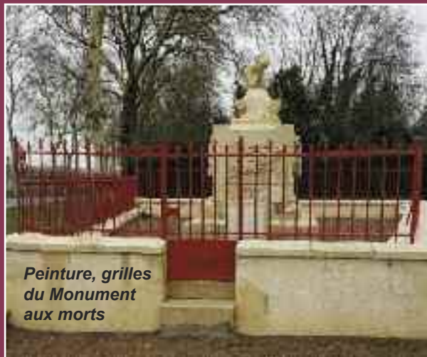
Peinture, grilles du Monument aux morts