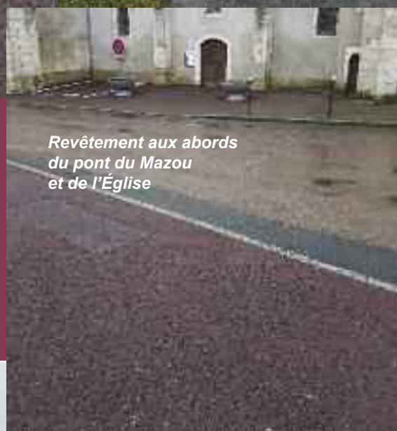
Revêtement aux abords du pont du Mazou et de l'Église